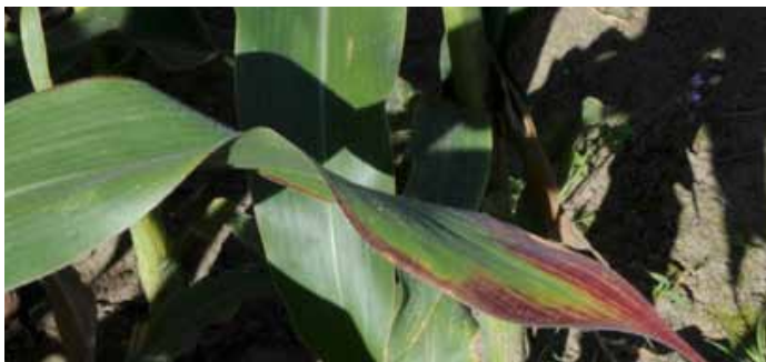
Недостиг на фосфор при царевицата.

Листното приложение на фосфор при стартирането на царевицата може да компенсира временният недостиг на фосфор предизвикан от студените и влажни почви в началото на сезона. Това е особено важно в периоди с по-късни възвратни застудявания през пролетта.