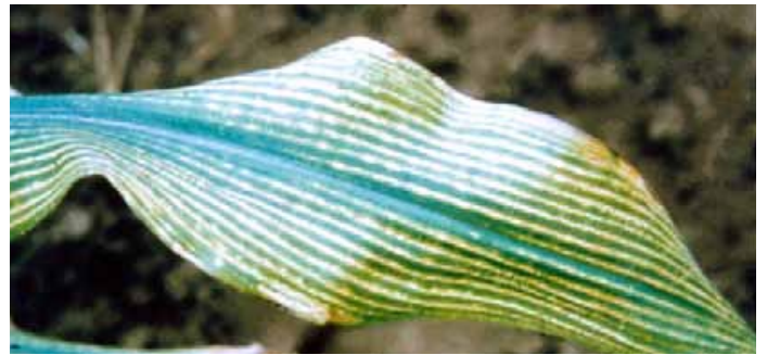
Недостиг на магнезий при царевицата

Недостигът на цинк и магнезий са най-често срещаните хранителни проблеми при царевицата в световен мащаб. И двата хранителни елемента влияят върху ранните етапи от развитието на царевицата, техният недостиг значително намалява добива.