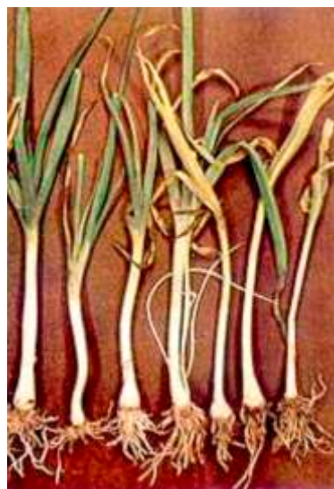
Недостиг на калций при праз.

Торенето с Yara Liva Tropicote ускорява развитето на луковичните култури и намалява разходите за производството им. Сравнение на растежа при торене само с азот и с Yara Liva Tropicote – азот плюс усвоим калций.