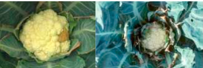
Недостиг на калций при карфиол.

Торовете за специалиста отглеждащ зелени култури: