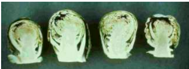
Недостиг на калций при брюкселско зеле.

Повреди от недостиг на калций по зелените култури: