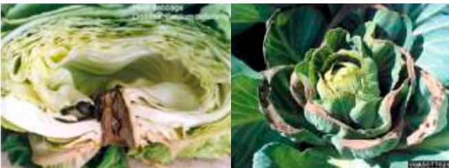
Недостиг на калций при зеле.